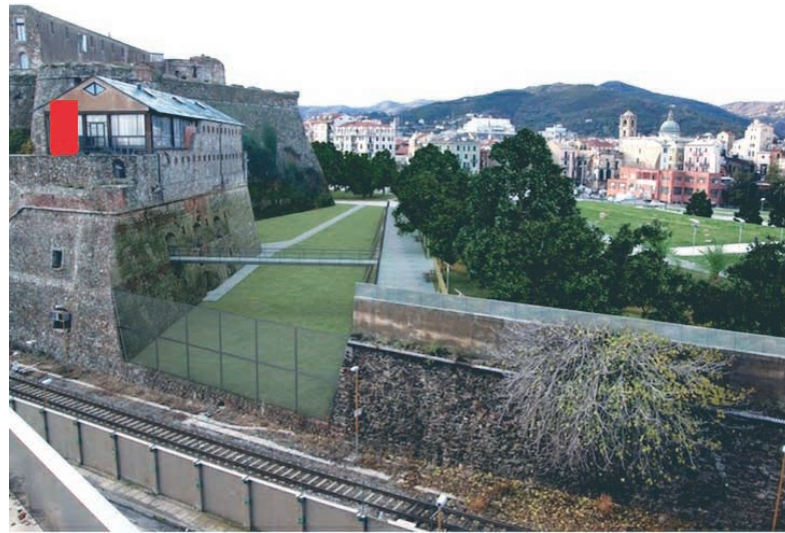
Nel rendering progettuale di "OR.SA.2000" è apprezzabile lo svuotamento del Fossato della Fortezza e il percorso pedonale di destra (sul lato di levante del muro di controscarpa); del tutto inutile e impattante è invece la passerella pensata per creare un nuovo accesso all'Ostello. È evidenziato in rosso l'inopportuno ascensore esterno.

Il 26 novembre 2014 l'ipotesi progettuale è stata esaminata dalla "Consulta Comunale per il Priamàr": gli esperti della Consulta si sono trovati concordi nel ritenere che l'idea progettuale vada decisamente modificata, respingendo l'ipotesi di realizzare un nuovo accesso sulla testata Sud dell'Ostello